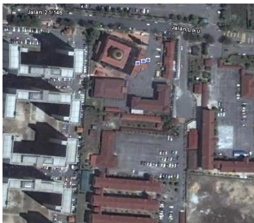
Rajah 1.1: Masjid al-Muqqarabin, Bandar Tasik Selatan, Kuala Lumpur

Rajah 1: Masjid-masjid yang berhampiran dengan sekolah