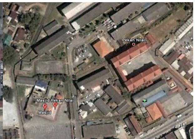
Rajah 1.2: Masjid Bandar Nilai, Negeri Sembilan